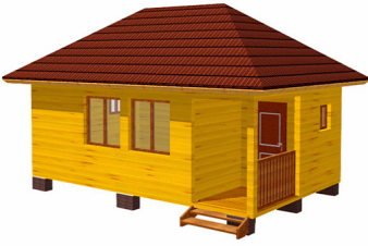
Баня ( Б-12 )