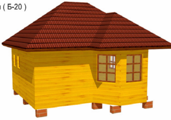
Баня ( Б-20 )

???? 6*5 ???? ?????????????????? ? ????????