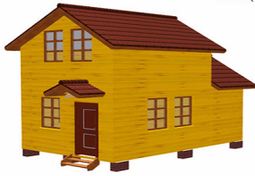
Баня ( Б-24 )