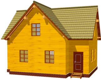
?? ? ? ????????????????? ???? 9 ? 8? - ?60